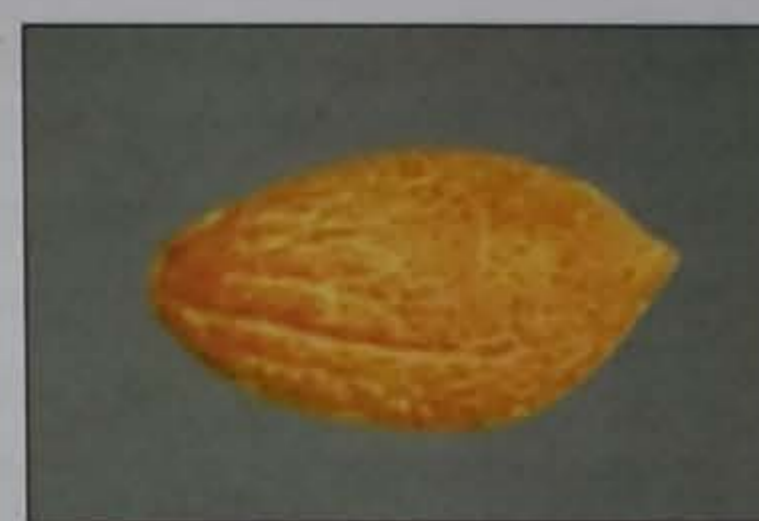
Πυρήνας ελιάς του 7 ου αιώνα π.Χ. Αιγαίου» (Κωστελένος 2011) που βρέθηκε στην Άνδρο (Megaloudi 2006)