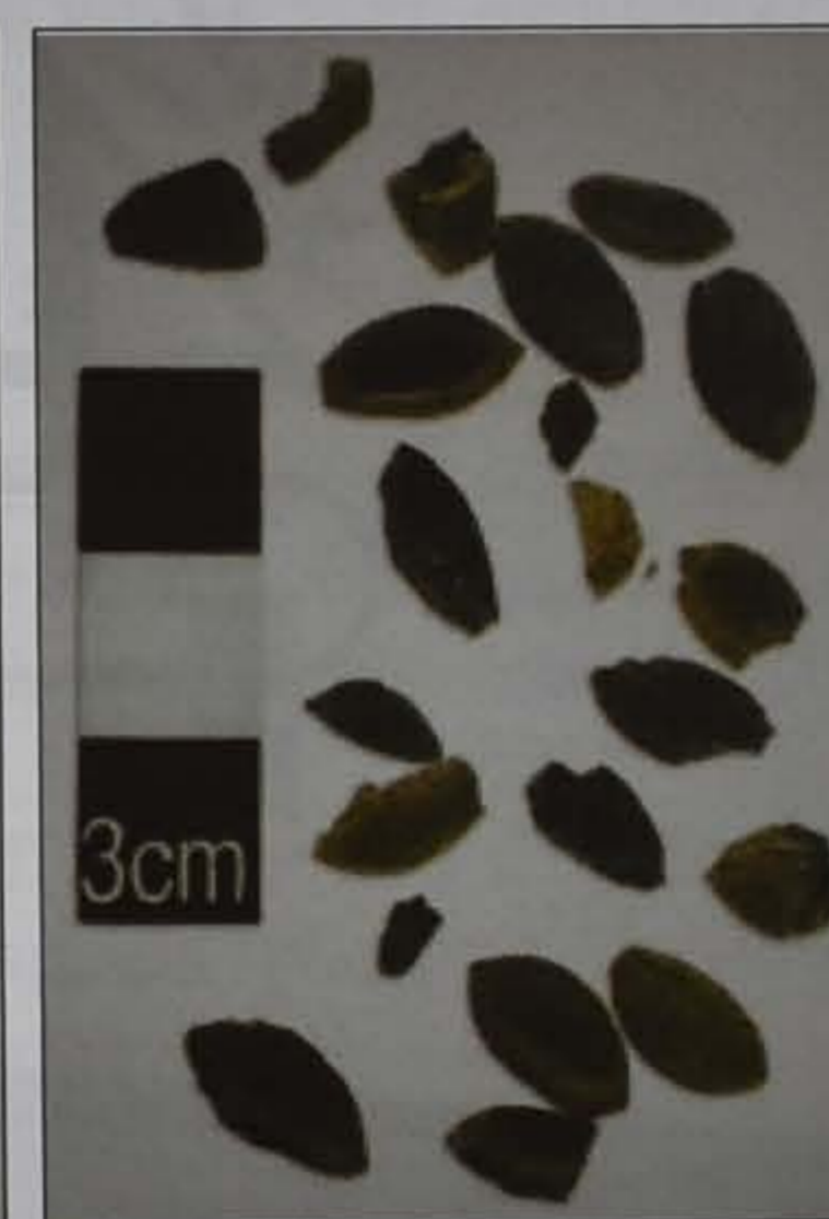
Πυρήνες ελιάς από Παλαιοανακτορικά (αριστερά) και Υστερομινωικά III (δεξιά) στρώματα ανασκαφών στην Κρήτη (Χατζή 2003)

Το ελαιόδεντρο της Νάξου είναι ένα ζωντανό μνημείο της φύσης, παγκόσμιας σημασίας, το οποίο χρειάζεται προστασία και προβολή. Τα αρχαιολογικά ευρήματα, οι πυρήνες και οι καρποί ελιάς, σε συσχέτιση με το ίδιο το δένδρο της γεροντολιάς, μαρτυρούν την καλλιέργεια ήμερων ελιών στον ελλαδικό χώρο τουλάχιστον τα τελευταία 5.000 - 6.000 χρόνια. Ειδικότερα η τοποθεσία Αδισσαρού στη Νάξο είναι το μοναδικό σημείο στον κόσμο, στο οποίο αποδεδειγμένα καλλιεργείται η ίδια ποικιλία ελιάς ακατάπαυστα, για τουλάχιστον 5.000 χρόνια.